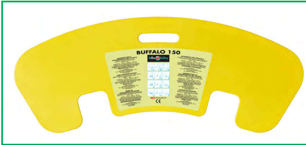
TABLA DE TRANSFERENCIAS "BUFFALO 150"